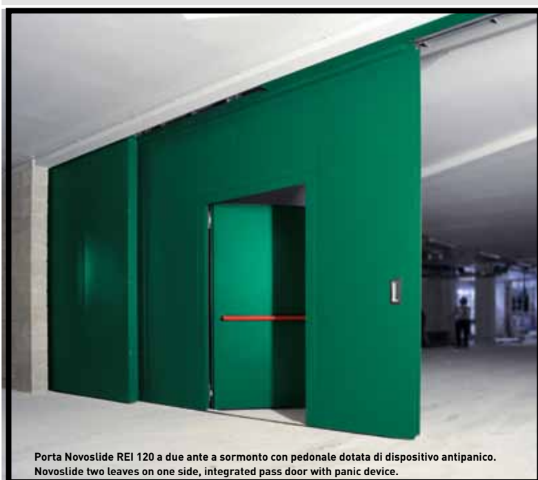
Porta Novoslido REI 120 a due ante a sormonto con pedonale dotata di dispositivo antipánico. Novoslido two leaves on one side, integrated pass door with panic device.