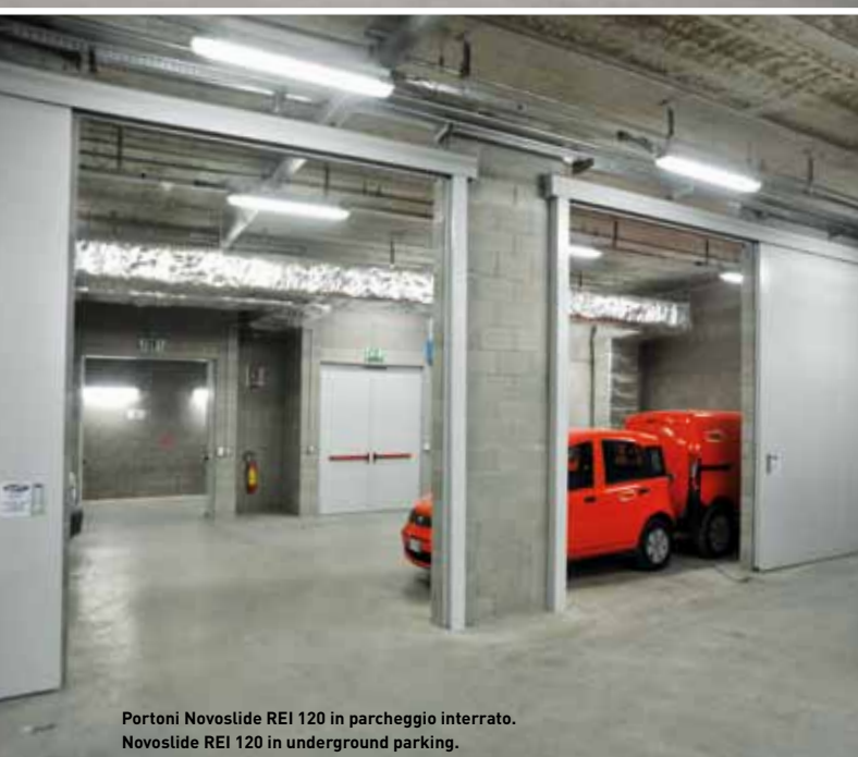
Portoni Novoslido REI 120 in parcheggio interrato. Novoslido REI 120 in underground parking.