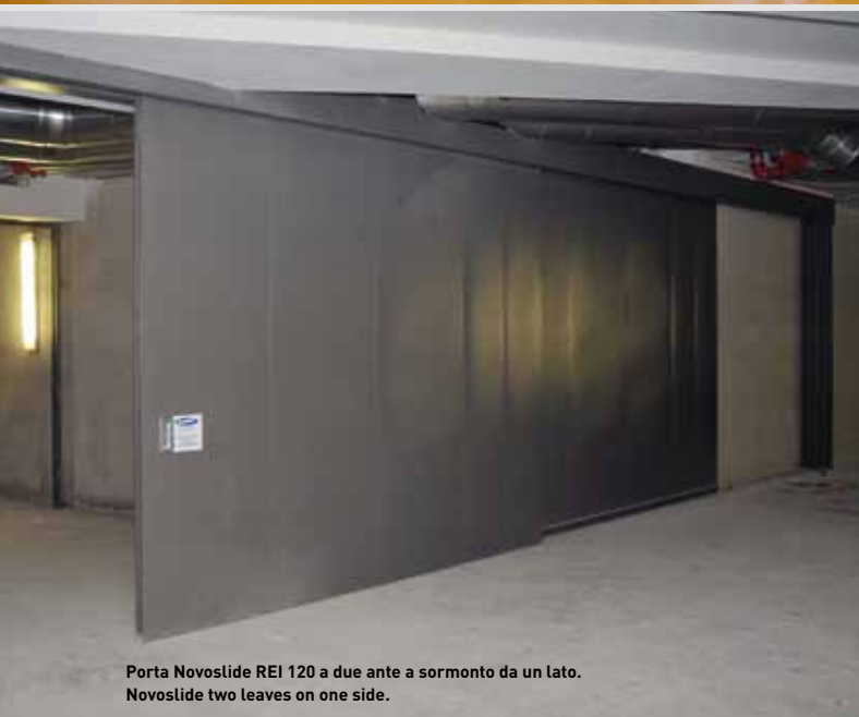
Porta Novoslido REI 120 a due ante a sormonto da un lato. Novoslido two leaves on one side.